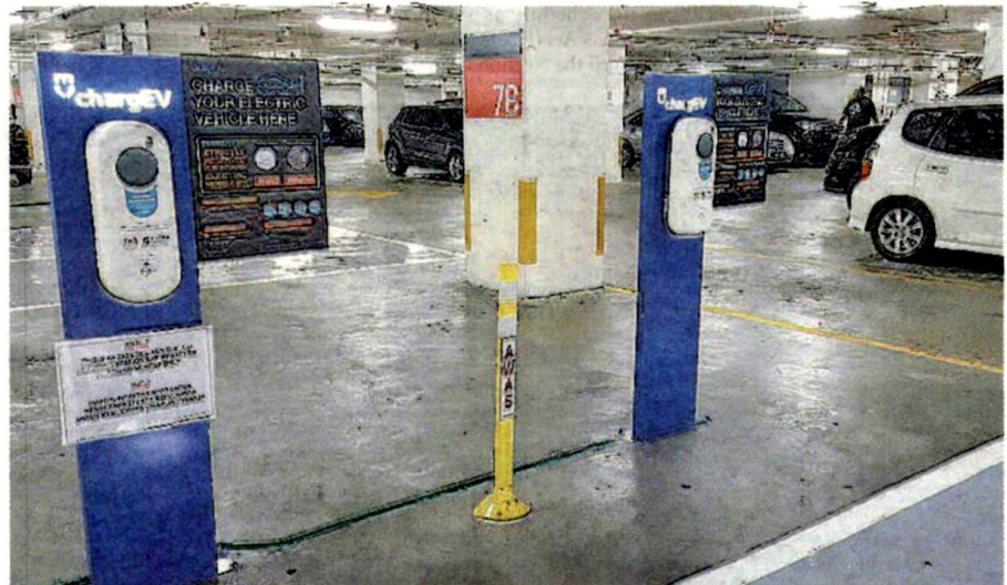
The strategies include offering incentive packages such as road tax exemption, income tax relief for the purchase of EVs and income tax relief for installing EV charging stations

"These include critical parts manufacturers, standard-setting,