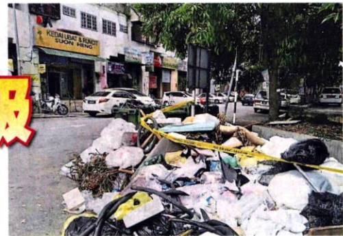
■不负责任人士在甲洞达雅花园的道路旁乱倒垃圾。

民众可透过市议会官网或联络KDEB承包商03 - 6128 3364，查询垃圾清收时间表。