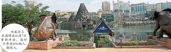
双威水上乐园将在10月7日重新开放,届时只开放50%的人潮进入。

“这是免费的旅游券,但民众必须购买旅游配套才能享有100令吉的折扣,如果只是派发免费的旅游券,很多人领了却不会使用,这样才能确保真正帮助到旅游业。”