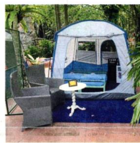
■ 双威主题乐园推出全新的露营配套，供应10个帐篷让访客亲近大自然。

旅游业逐步开放，为此，双威主题乐园将在本周四（7日）重新开放，让少于5000名旅客入内参观与游玩。