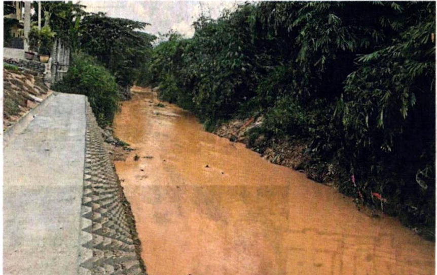
■水利灌溉局建议明年延伸河堤150公尺。