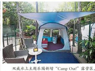
双威水上主题乐园新增“Camp Out”露营区,民众可以体验在乐园内露营过夜。