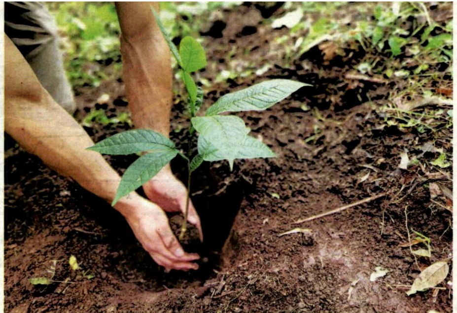
ANGKASA akan menggalakkan koperasi yang berada di bawahnya untuk menyokong usaha penanaman semula pokok di seluruh negara.

Selain itu, ia turut menyumbang kepada masa hadapan yang lebih hijau dan lestari untuk dinikmati oleh