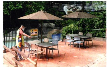
■ 工作人负责在双威主题乐园内进行消毒工作，以便在周四（7日）重新开放。

“这项旅游固本的使用期限从10月22日至明年6月30日，适用于28个与雪州政府合作的旅游单位，所推出的旅游配套。”