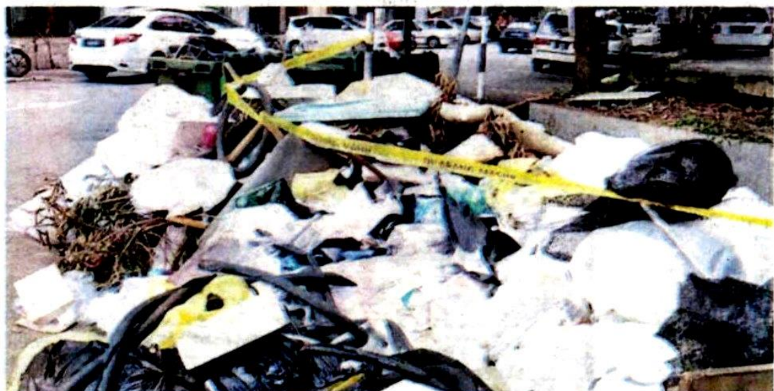
Sampah pukal dan sisa industri dibuang di sekitar Taman Daya Kepong, Selayang yang sebelum ini telahpun dibersihkan.

“MPS berharap perkara ini tidak berulang dan orang ramai disaran menjadi mata dan telinga bagi melaporkan pembuangan sampah di kawasan itu,” katanya.