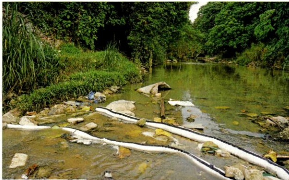
Lagi sungai tercemar

LEMBAGA Urus Air Selangor (LUAS) menggunakan peralatan menyerap minyak marjerin dari kilang pembuatan bahan roti di Kampung Baru Balakong, Cheras, Selangor yang memasuki Sungai Balak semalam. (Berita di muka 32)