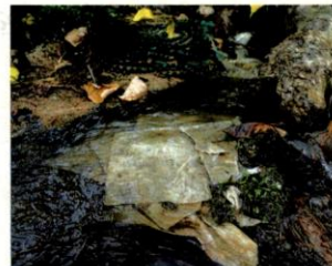
SEBANYAK 50 alat penyerap diletakkan bagi menyekat efluen minyak dari terus mengalir di Sungai Balak, Balakong, Cheras, Selangor.

SHAH ALAM: Sebanyak 50 alat penyerap minyak ( Oil Pad dan dua Oil Boom ) diletakkan bagi menghalang pencemaran minyak marjerin di Sungai Balak yang mengalir keluar dari sebuah tangki dekat kilang pembuatan bahan roti di Kampung Baru Balakong, Cheras, Selangor. Tindakan itu diambil selepas pensampelan air dibuat dan mengesan pelepasan efluen minyak berliku di sungai tersebut dan hasil analisis oleh Lembaga Urus Air Selangor (LUAS), terdapat kesan dan bau busuk minyak masak dikesan. Menurut Exco Pelancongan dan Alam Sekitar, Hee Loy Sun, langkah proaktif diambil Pengurusan Air Selangor Sdn. Bhd. (Air Selangor) sejak malam semalam bagi mengesahkan pencemaran berkenaan memberi kesan kepada Sungai Langat dan menghentikan sementara operasi Loji Rawatan Air (LRA) Bukit Tampoi. "Siasatan awal mendapati terdapat bau minyak masak dikesan di Sungai Balak. LUAS juga menemui sisa minyak di dalam aliran yang dilaporkan berlaku pelepasan efluen akhir dari premis dan bertemu Sungai Balak. "Jarak dari lokasi pencemaran ke muka sauk LRA Semenyih 2 adalah 15 kilometer (km), LRA Bukit Tampoi 24.5 km dan LRA Labohan Dagang adalah 36 km," katanya dalam satu kenyataan. Beliau menambah, bagaimana-napun, pensampelan ujian bau yang dijalankan LUAS di Sungai Langat di Jambatan Kampung Teras Jernang dan LRA Bukit Tampoi mencatatkan bacaan sifar (0) ton dan aliran sungai dalam keadaan normal.